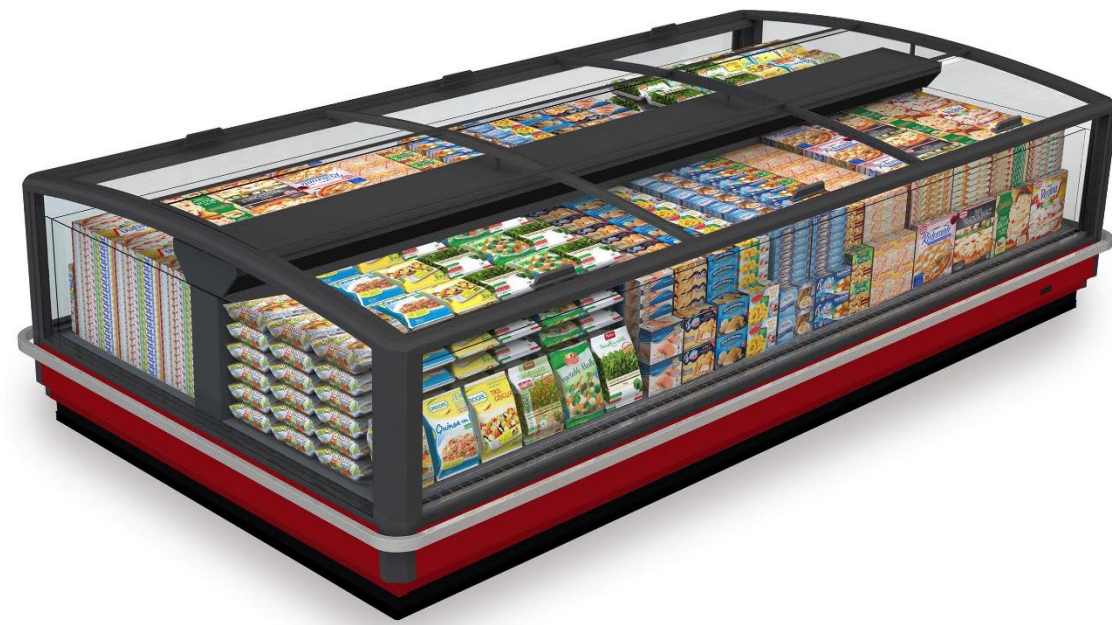
GranOntario L (Large)

Die Verkaufsinselfn GranOntario und GranDrake modernisieren den TK-Bereich, ihre Auslage verfügt über eine hohe Kapazität und ihre hochtransparente Verglasung gewährleistet die maximale Warensichtbarkeit.