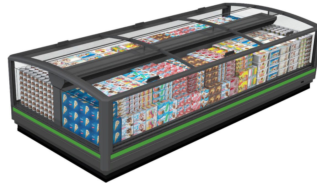
GranOntario N (Narrow)