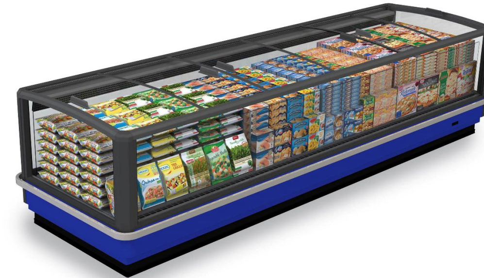
GranOntario C (Compact)