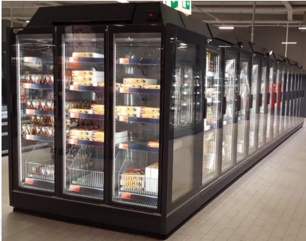
Foto di negozi

Fine linea 3D-S per isole più strette, offre maggior spazio ai clienti