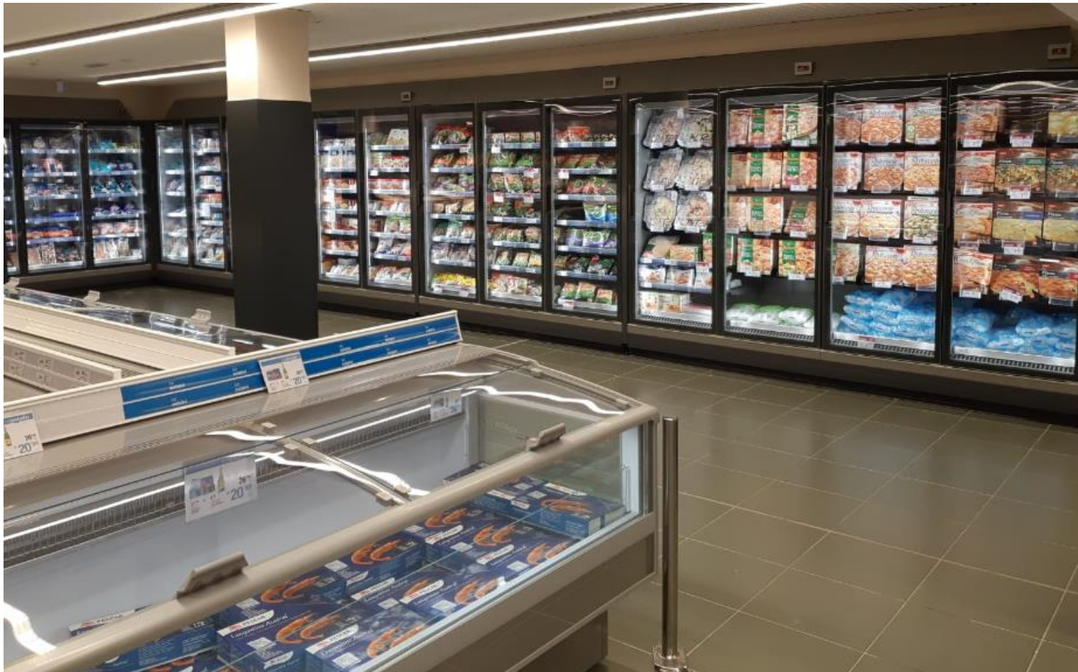
Area frozen con Beluga